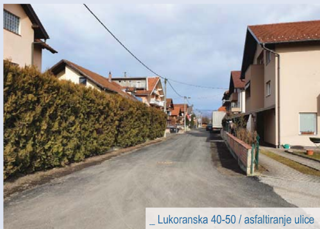
_ Lukoranska 40-50 / asfaltiranje ulice