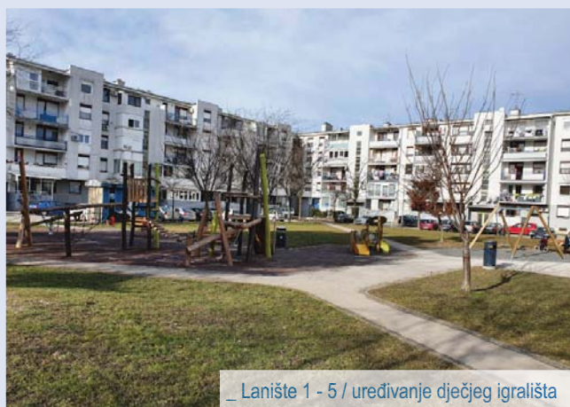
_ Lanište 1 - 5 / uređivanje dječjeg igrališta