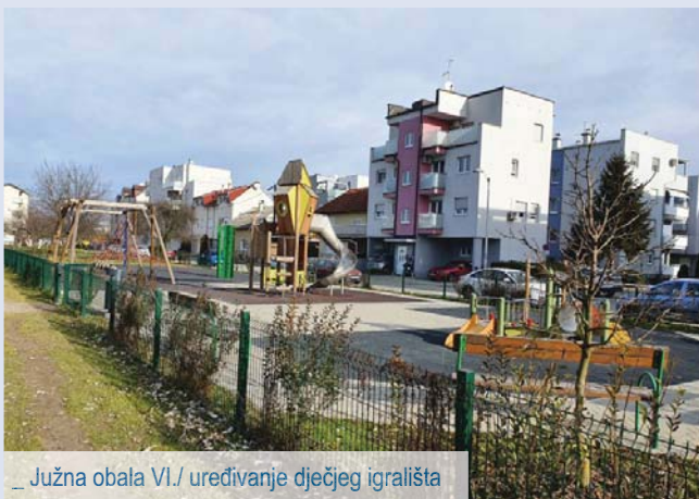
_ Južna obala VI./ uređivanje dječjeg igrališta