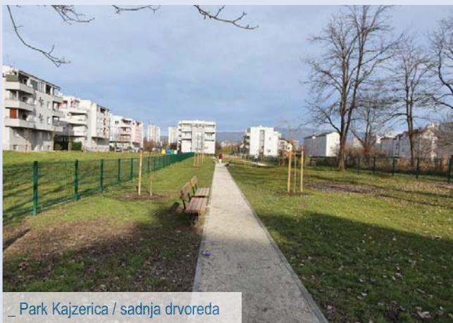
_ Park Kajzerica / sadnja drvoreda