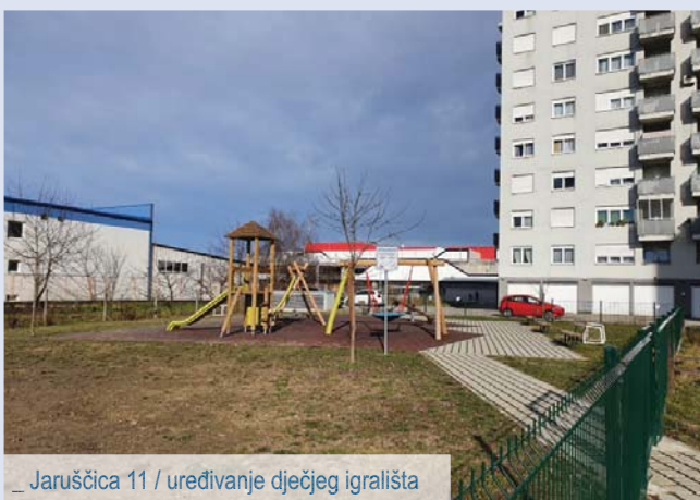
_ Jaruščica 11 / uređivanje dječjeg igrališta