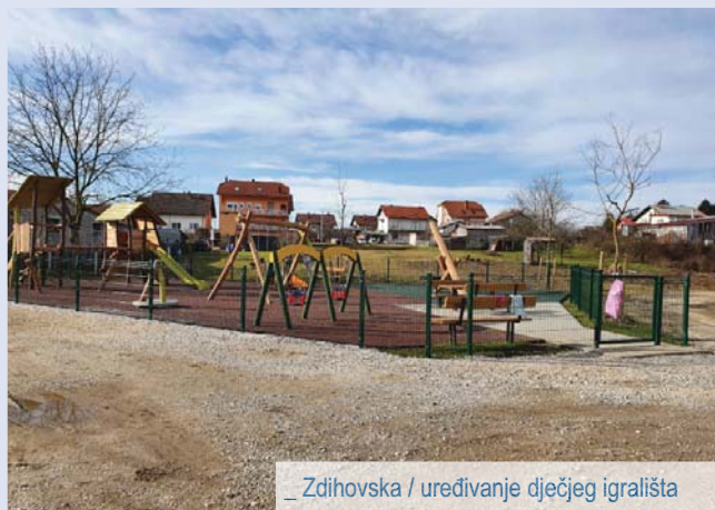
_ Zdihovska / uređivanje dječjeg igrališta