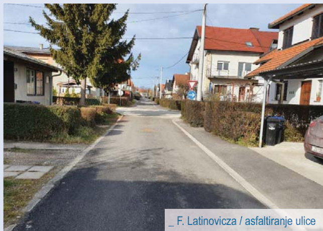
_ F. Latinovicza / asfaltiranje ulice