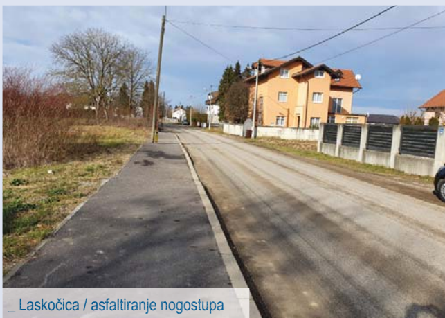
_ Laskočica / asfaltiranje nogostupa